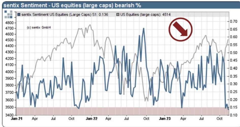
sentix Sentiment US equities (bearish %) and S&P 500 Index